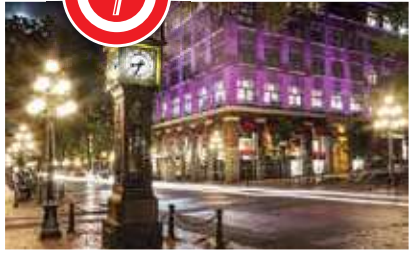
【煤氣鎮】溫哥華市的經濟發源地,充滿歐陸色彩,地球上第一個蒸氣鐘是該地的標誌