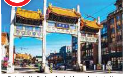
【唐人街】加拿大第一大唐人街