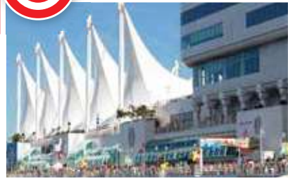
【加拿大廣場】建於1986年,是現在溫哥華著名五帆港口的地標