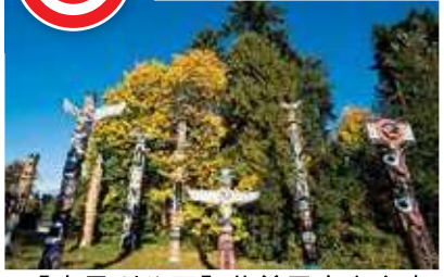
【史丹利公園】北美最大之市中心公園。海堤南岸更是遊客必到及溫哥華市最佳之拍攝景點