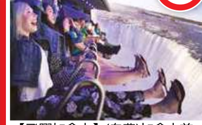
【飛躍加拿大】(自費)加拿大首個也是全國唯一一個4D模擬飛行項目