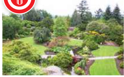
【女皇公園】溫哥華西區小山丘上,152公尺高可俯覽溫市的景色,遠眺北溫群山