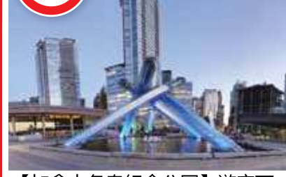
【加拿大冬奧紀念公園】遊客可以與2010年冬奧聖火盆拍照留念